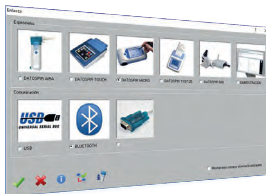
Compatibile con tutti gli spirometri Sibelmed