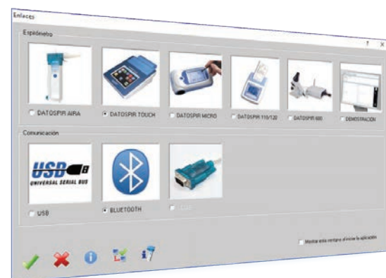
Compatibile con tutti gli spirometri Sibelmed