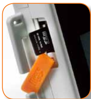
Scheda di memoria Micro SD rimovibile.