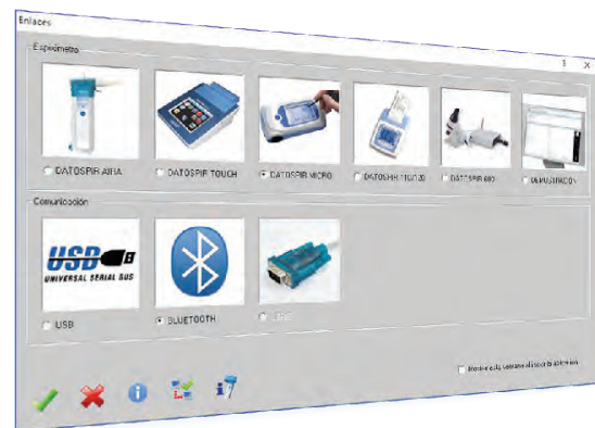
Compatible con todos los espirómetros Sibelmed