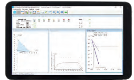
Apto para tablet con Windows 10