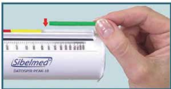
Herramienta de autocontrol (semáforo) / Sistema a zone colorate

Este equipo ha sido verificado y calibrado en SIBEL,S.A según el procedimiento y verificación de ajuste.